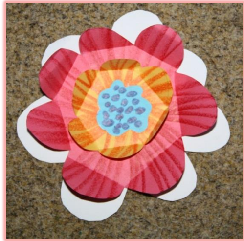
Kresba olejovým pastelem.