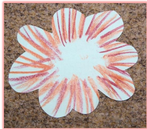
Před lepením dobarveno.