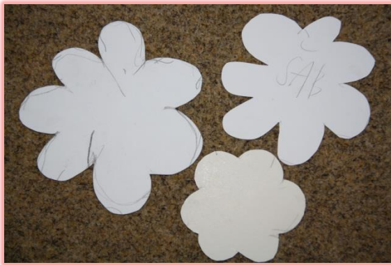
Základem jsou 3 různě veliké květy.