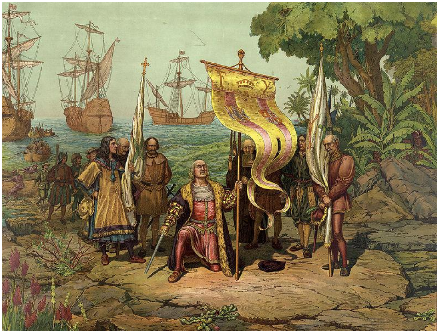
Kryštof Kolumbus připlouvá do Ameriky, začíná novověk