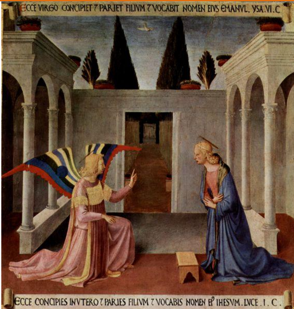
Fra Angelico, Zvěstování, renesanční malíř využívá perspektivu v malbě