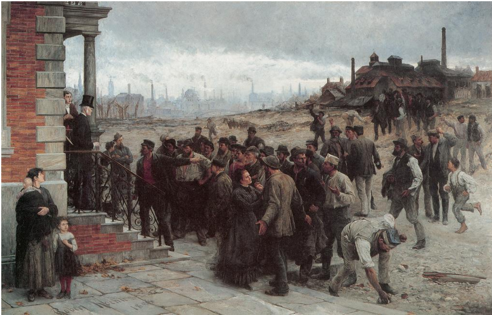
obraz „Stávka“, 1886