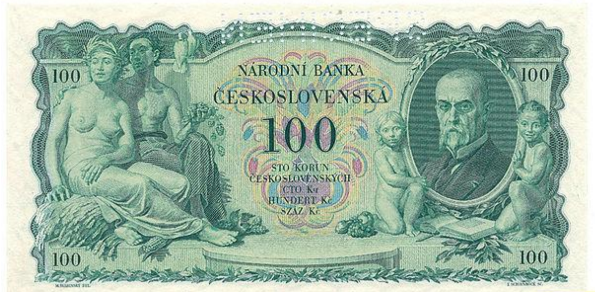
100 korun československých s portrétem prezidenta, 1931