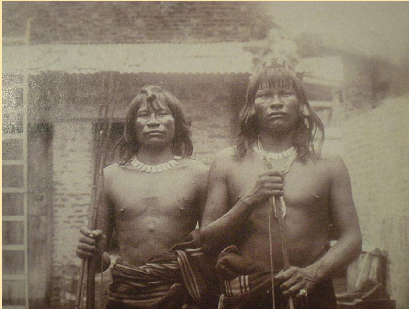
Původní obyvatelé jižní Ameriky