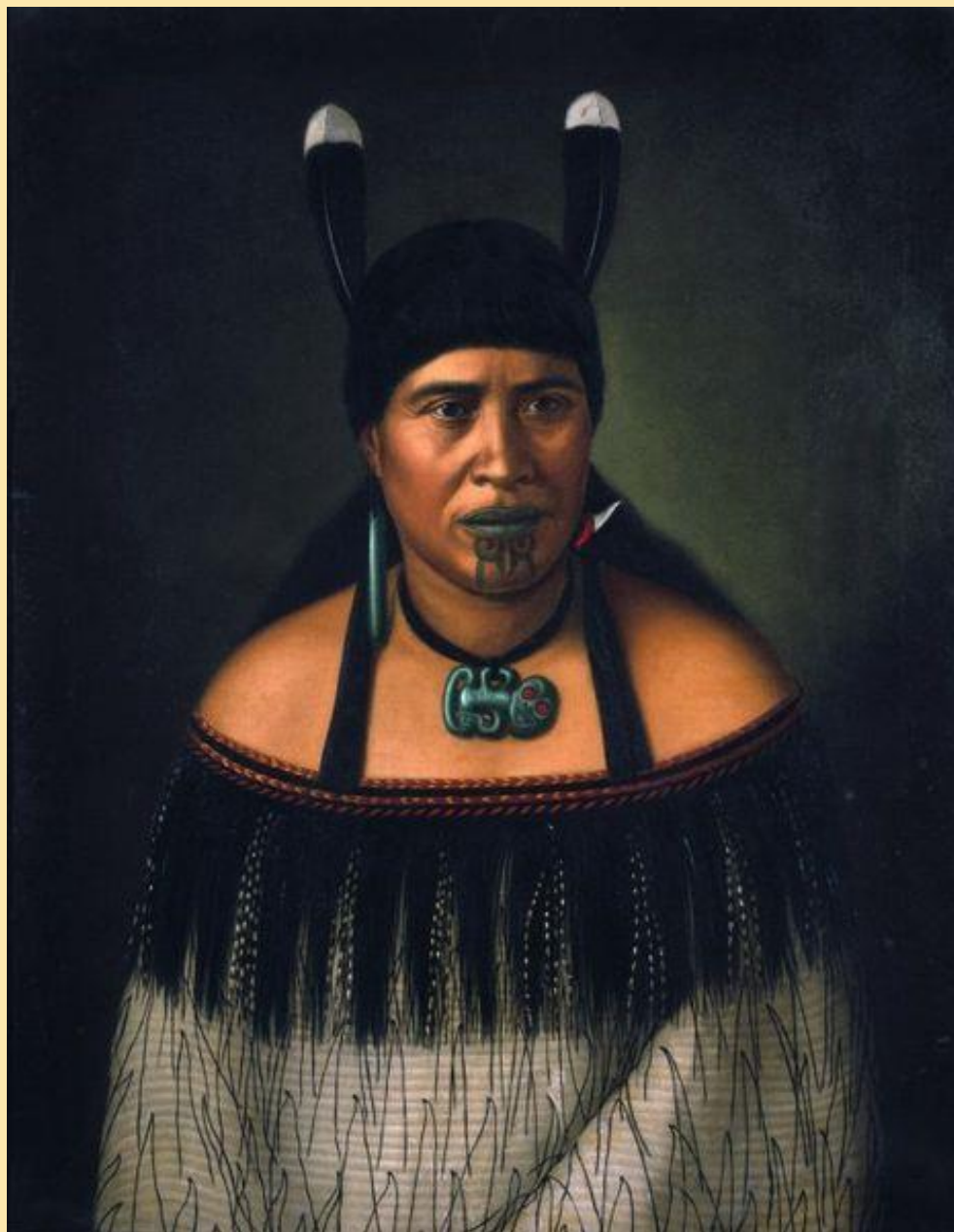
Žena z maorského kmene – Nový Zéland, konec 19. století