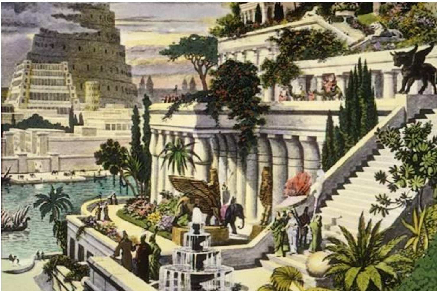
jeden ze sedmi divů světa – visuté zahrady v Mezopotámii (představa malíře z 19. st.)