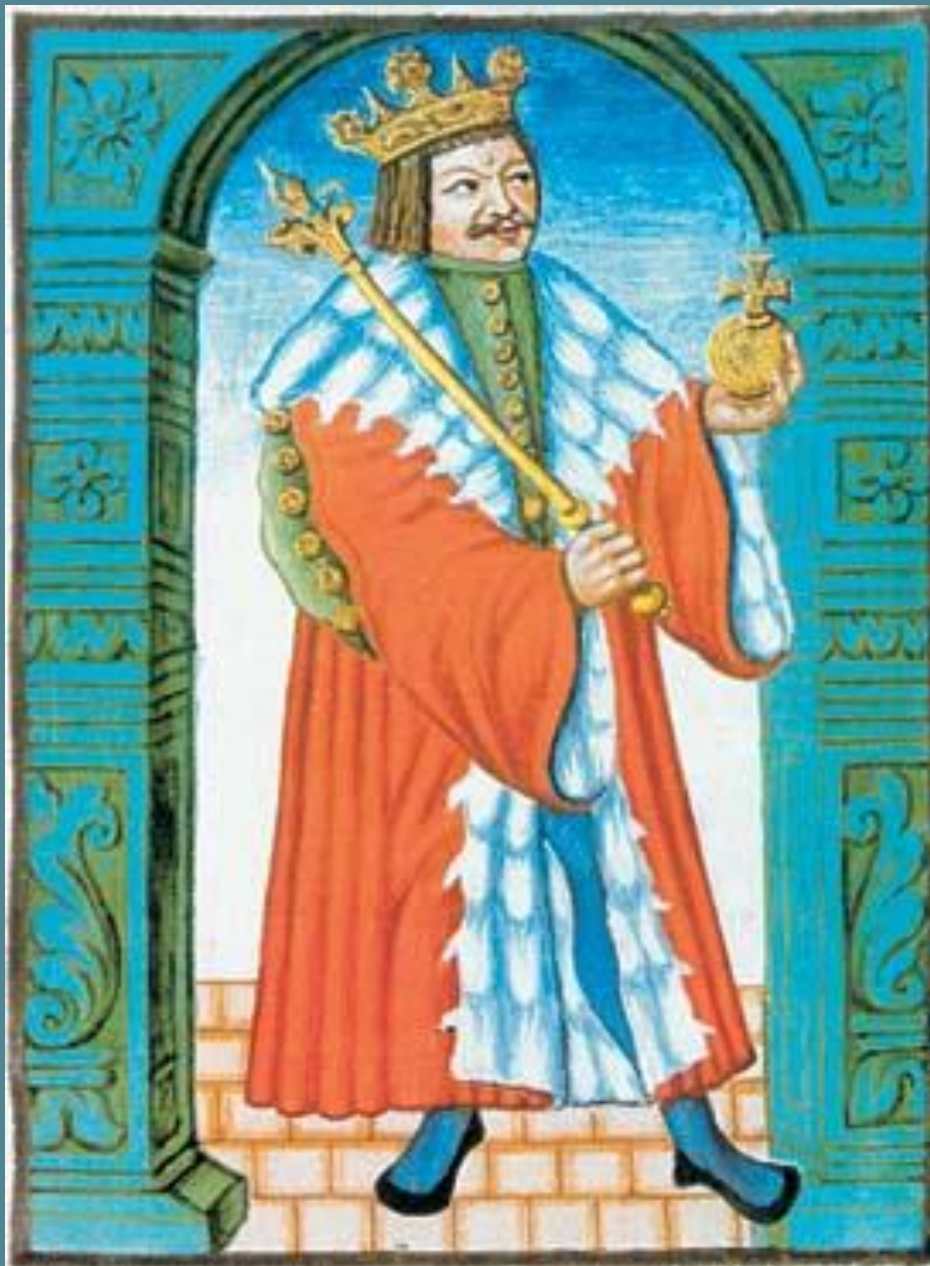
Král Jiří z Poděbrad