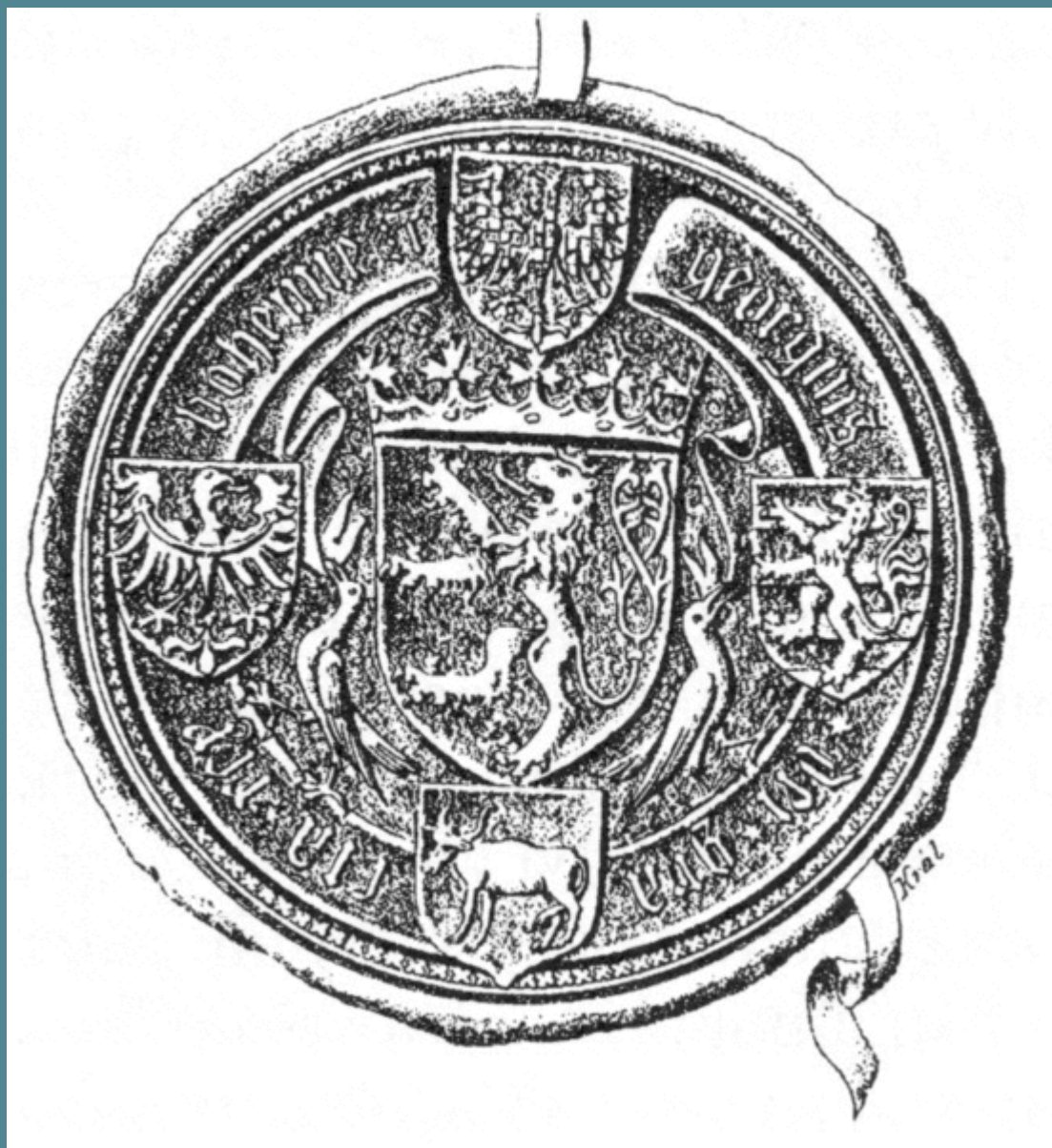
Pečeť Jiřího z Poděbrad