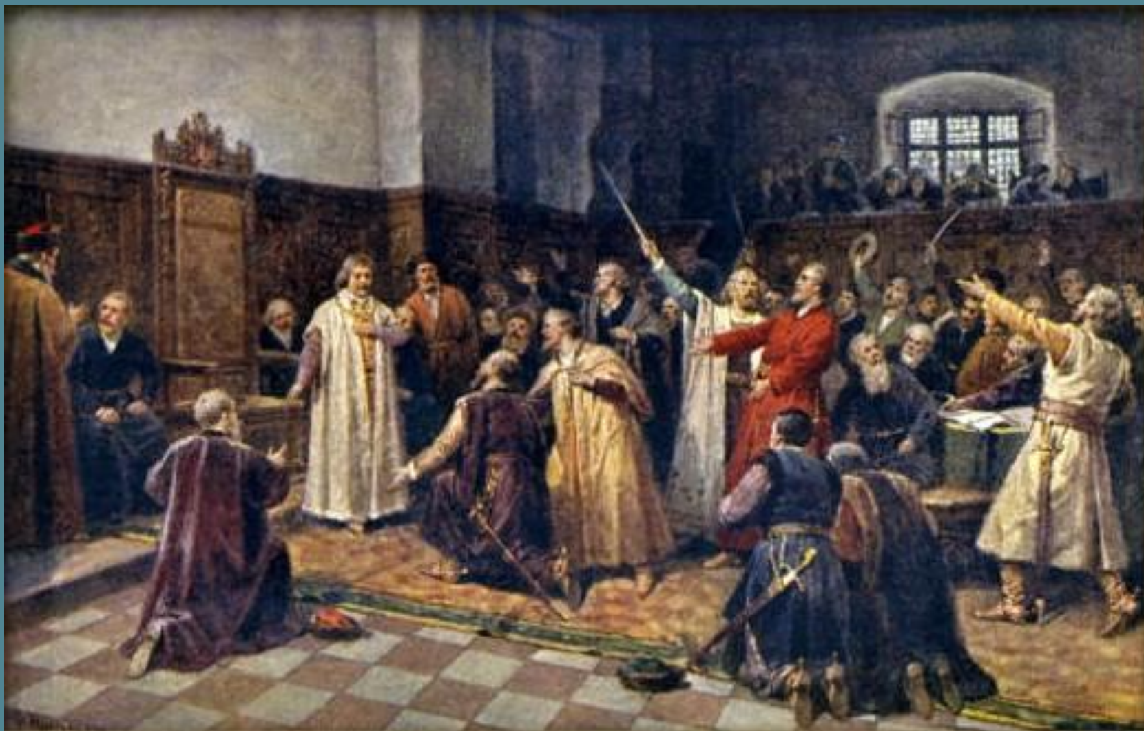
Zvolení Jiřího z Poděbrad českým králem