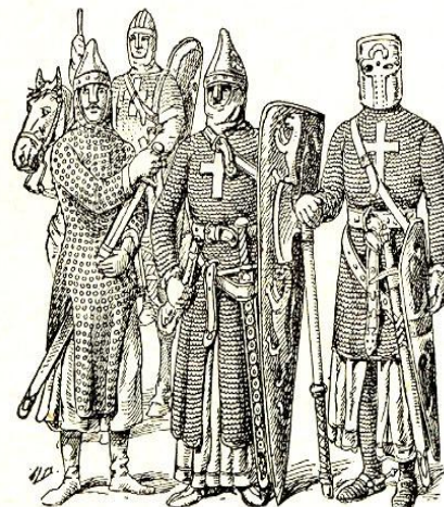
Croisés (XI e -XIII e siècles).